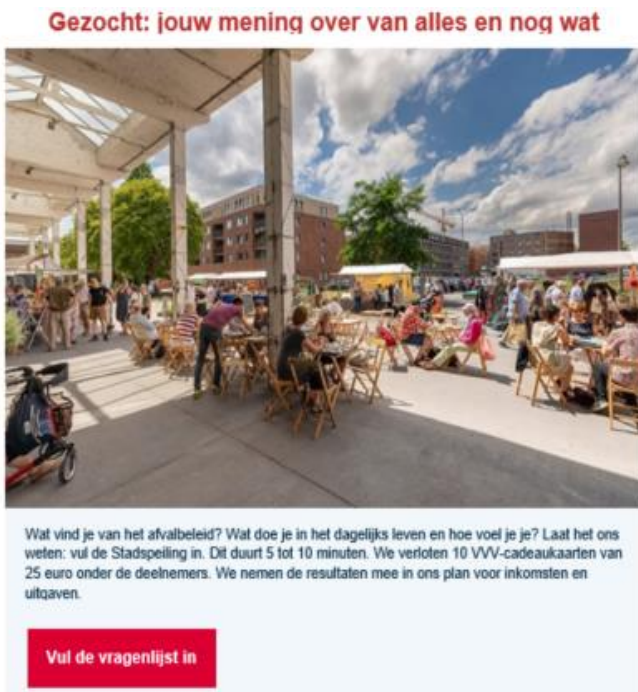
Nieuwsbrief gemeente Maastricht (12 juni)